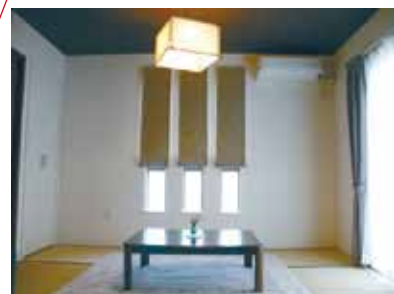
▲ リビングに隣接した和室は、独立和室としても、リビングと繋げても使えるようになっており、用途に応じてフレキシブルに使うことができます。また日がよく入るため、リビングとの戸を開けても十分明るくとても快適と好評です。