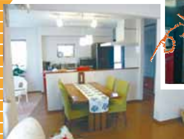
▲ 周りを一周できるキッチンは、行き止まりがなく動線も抜群!