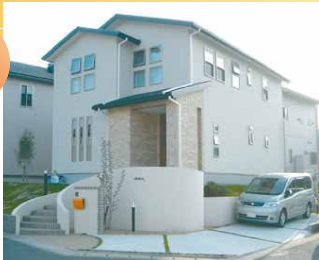
外構も素敵にデザインされた、I様邸。

2階に上がるとまず目に入るのは、鏡張りのバレエのレッスンスペース。小さな頃からバレエを習っているというお嬢様のためにお家でも練習できるようにと作られました。また、子供部屋は、壁の一部を男の子はグリーン、女の子は黄色にしてアクセントカラーを加えました。それぞれとっても可愛い雰囲気のお部屋になっていて、お子様もお気に入りのようです。主寝室は書斎とクローゼットも含めて10畳。そのうち1/4の広さを占めるクローゼットは、ウォークスルー型となっており、