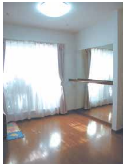
お嬢様がバレエの練習ができるようにとつくったレッスンスペース。

今回、外構にも力をいれたというI様。特にらせん状の階段を用いたアプローチが目を引き、建物の雰囲気にとっても良く合い、より高級感を感じさせます。ガーデニングや家庭菜園を始めて、休日は庭の手入れを頑張っているという様。お子様も進んでお手伝いをしてくれて、親子で楽しみながら進めているそう。これからますます素敵なお家になりそうです。