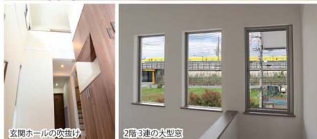
玄関ホールの吹抜け

また、この住まいには、注文住宅の利点を生かした専用造作が各所にあります。和室に設けた“ふすま収納スペース”、キッチンに設けた“小物収納ラック用スペース”、リビングの“ハンモックフックの基礎工事”等々。これらは、I様と設計者、そして大工等の職人とのコミュニケーションの賜物でしょう。