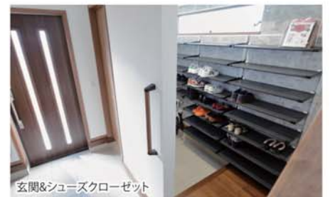
玄関&シューズクローゼット

ご主人は「アパート暮らしの時より、通勤距離は長くなりましたが、毎日家に帰るのが楽しみです。やりたい事がいっぱいあって・・・。」と、我が家の作り込みを満喫中のようです。